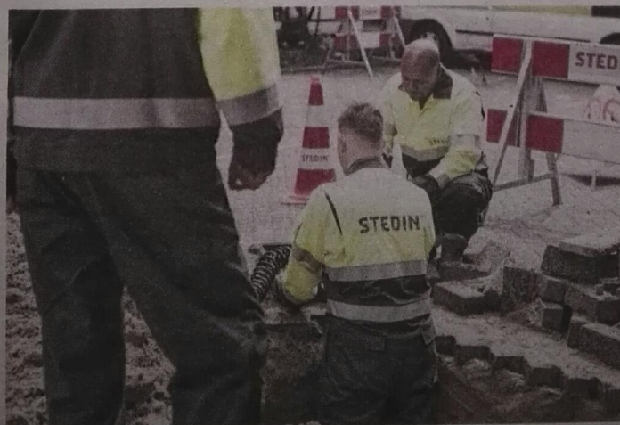
▲ Netbeheerder Stedin wil geen aardgasleidingen meer.

Het complex aan de Prins Mauritsingel is compleet. De bewoners, vier vrouwen en twee man-